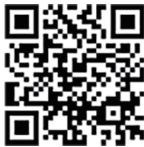
[ 官网了解更多 ]